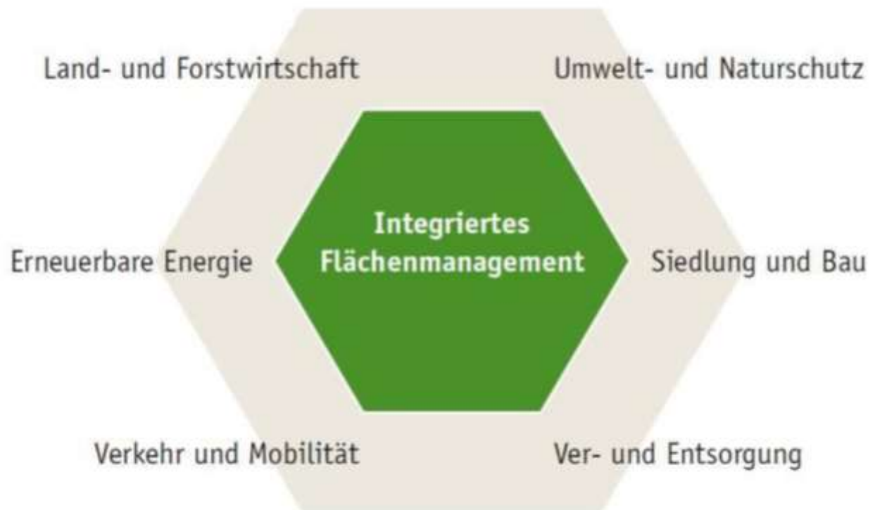
Abbildung 1: Integriertes Flächenmanagement im Spannungsfeld der Landnutzung